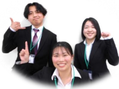
2022年新卒入社スタッフ